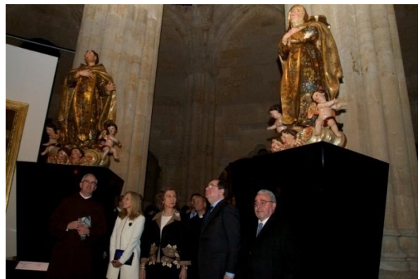
Inauguración Teresa de Jesús, maestra de oración . Ávila y Alba de Tormes 23 de marzo de 2015