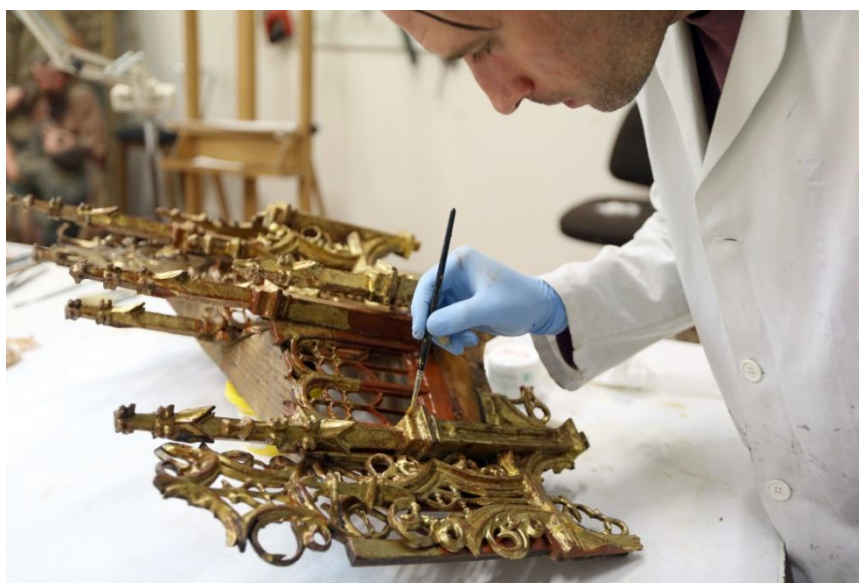
Trabajos en el Taller de Restauración de la Fundación

La Fundación Las Edades del Hombre dispone de uno de los Talleres de Restauración más reconocidos de nuestra Comunidad Autónoma. Se localiza en el monasterio de Santa María de Valbuena, San Bernado (Valladolid). Desde el año 2002 que inició su actividad los profesionales que lo integran han intervenido en numerosas obras artísticas de distintas épocas y materiales devolviéndoles el esplendor que habían perdido con el paso del tiempo y sentando las bases necesarias para una correcta conservación. Entre las más de 4.000 piezas artísticas restauradas, muchas de ellas de un valor incalculable, han pasado por los Talleres de Las Edades del Hombre obras de Gregorio Fernández, Alejo de Vahía, Alonso Cano, Bartolomé Esteban Murillo, Hans Memling, Alonso Berruguete, Luis Salvador Carmona o Felipe de Espinabete.