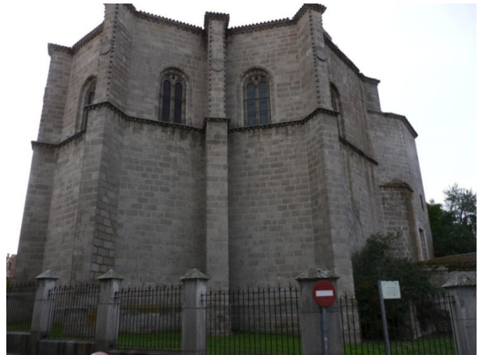
Capilla de Mosén Rubí. Ávila