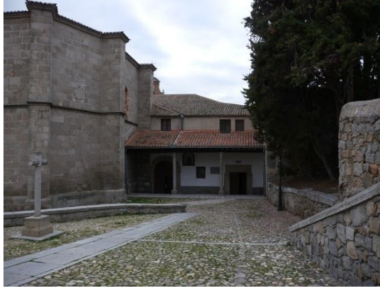
Convento de Nuestra Señora de Gracia. Ávila