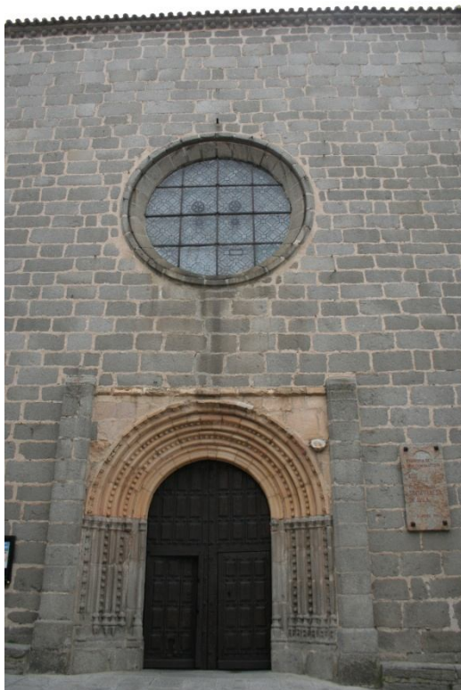
Iglesia de San Juan Bautista. Ávila